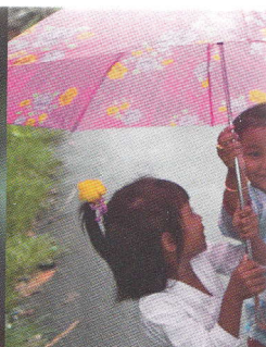
Flori la Candikuning