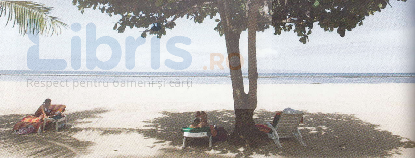
Plaja de la Sanur