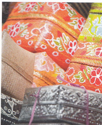
Cutii din paie pentru ofrande

La est, regiunile Klungkung și Karangasem sunt dominate de cel mai înalt munte de pe insulă, Gunung („Muntele”) Agung, centrul spiritual al celor mai mulți balinezi. Sate izolate, conservatoare, păstrează tradițiile artistice și obiceiurile antice. Coasta de nord a Baliului, regiunea Buleleng, este agricolă, aici cultivându-se de toate, de la mirodenii la struguri. Munții aproape că intră în mare pe înguste plaje cu nisip negru, mângâiate de valuri domoale.