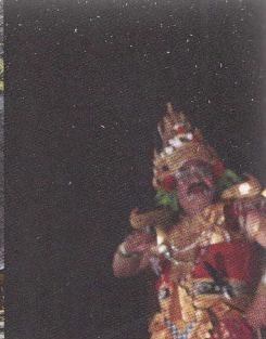
Pura Gunung Kawi, Tampaksiring

în abilitatea remarcabilă de a adopta, adapta și absorbi.