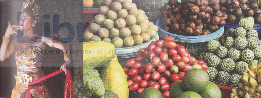
Dansatori de legong