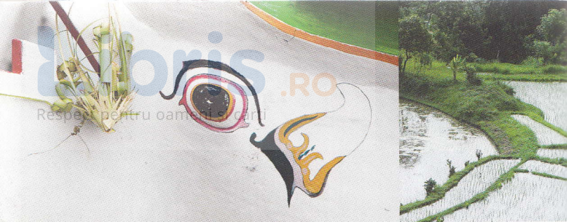
Bărci cu furchet la Amed

nezia a trecut la democrație în ultimii zece ani.